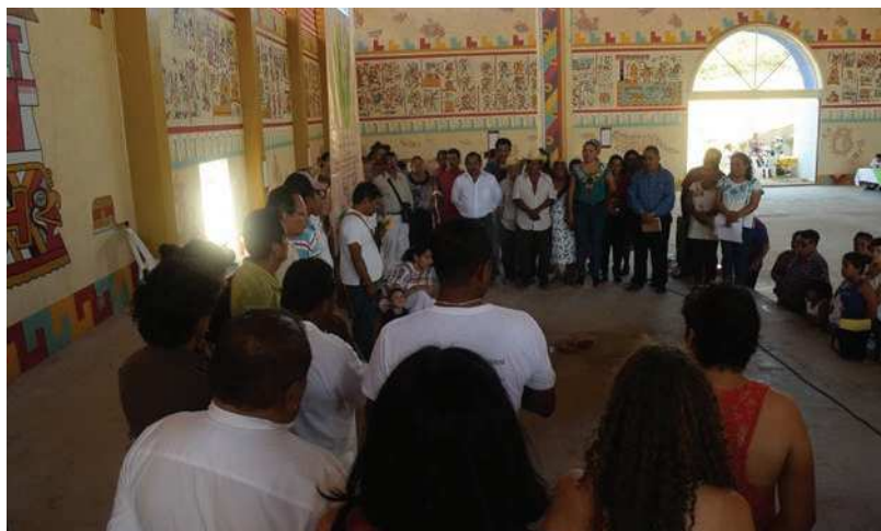
Reunión discusiones Código de Ética. Tututepec, Oaxaca, México.

Una vez aprobado por la Asamblea General de la SOLAE, se establece que las personas que realicen investigaciones etnocientíficas en América Latina, sean o no oriundas de la región, deben llevar a cabo sus investigaciones y trabajos etnobiológicos, bajo las normas asentadas en este documento. Se determinó