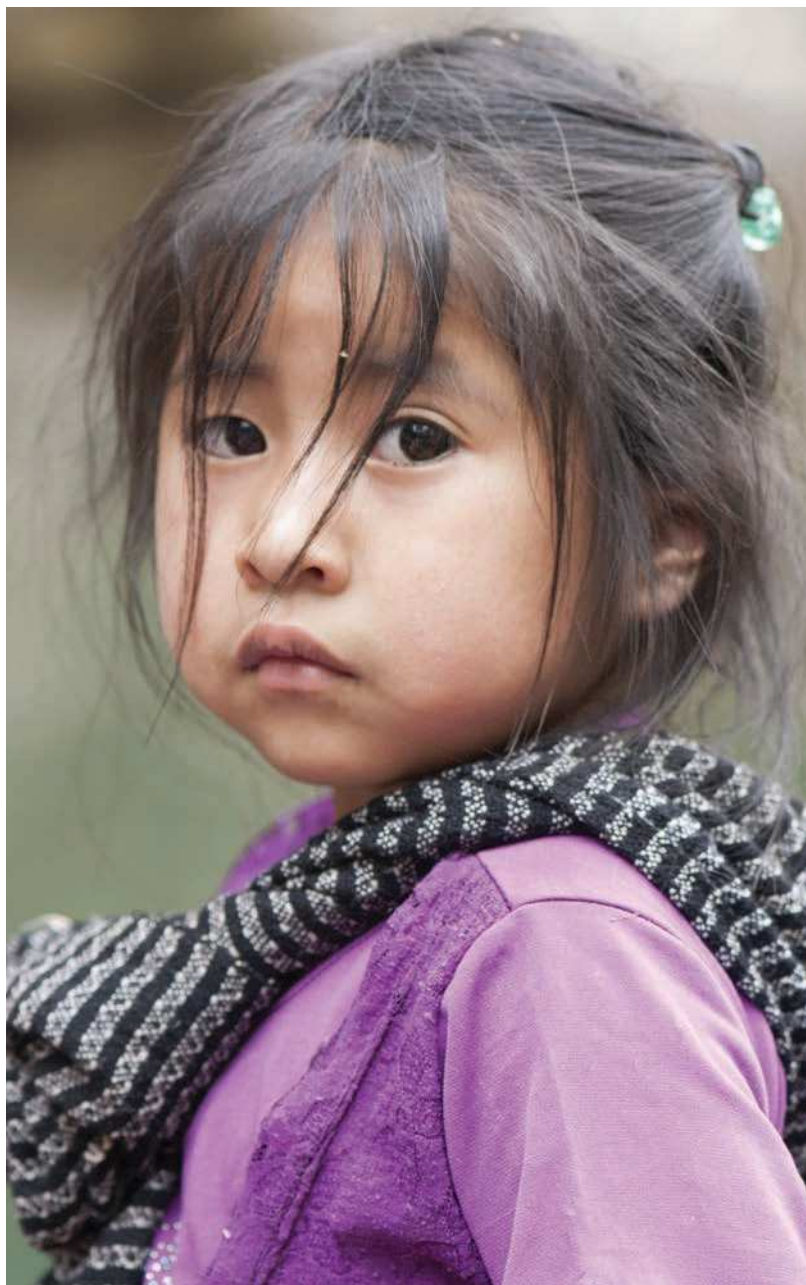
Niña nahua. H. David Jimeno S.(México). ganadora del 4o. lugar en el 1er. Concurso Latinoamericano de Fotografía Etnobiológica, efectuado en el marco del IV Congreso Latinoamericano de Etnobiología y V Congreso Colombiano de Etnobiología. Popayan, Colombia. Septiembre 2015.