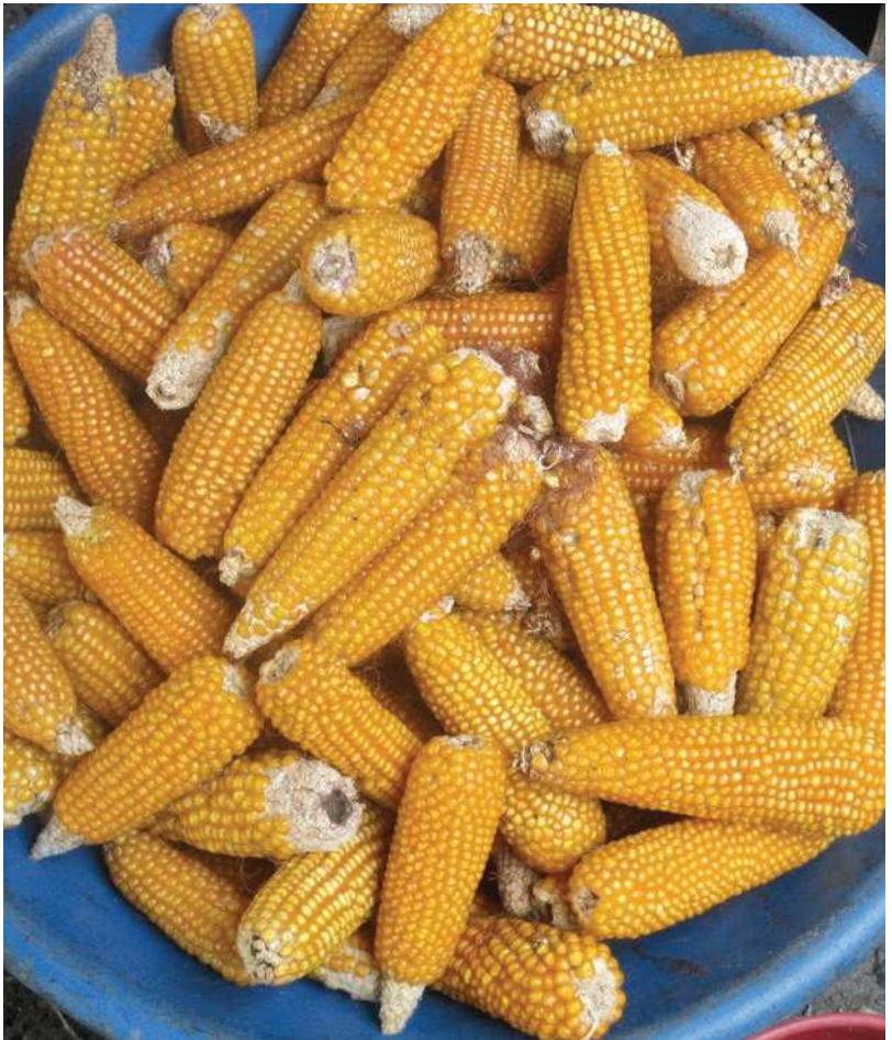
Maíz o mazorca capio cultivado en la zona baja del río Atrato, Mercado de Quibdó, Departamento de Chocó, Colombia.

2004), la Declaración de las Naciones Unidas sobre los derechos de los pueblos indígenas (2007), la Declaración del día Mundial de la Justicia Social, bajo los principios de la diferencia, la discriminación positiva, la equidad y la igualdad de oportunidades, por la Asamblea General de las Naciones Unidas (2007), el Protocolo de Nagoya sobre Acceso a los Recursos Genéticos y Participación Justa y Equitativa en los beneficios que se deriven de su participación (2010): la Declaración de los Pueblos Indígenas sobre el Desarrollo Sostenible y la Libre Determinación Río+20, (2012) y la Declaración americana sobre los derechos de los pueblos indígenas (2016), entre otros.