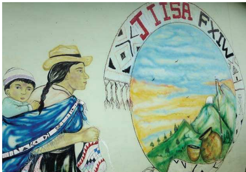
Mural en pared de escuela. El texto escrito en nasa yuwe y dice: «semillas de vida». Municipio de Inzá, Departamento de Cauca, Colombia.

Actualmente dicha riqueza biocultural enfrenta fuertes amenazas y retos. Desde lo ambiental se presentan fenómenos como el cambio climático y el uso inadecuado de los recursos naturales y del subsuelo. Desde una perspectiva económica los modelos dominantes tienden a la expansión de la acumulación capitalista, a la sobre explotación del agua, los bosques, los minerales y a la homogenización cultural, así como a la consiguiente privatización de recursos de bien común, la desacralización de la naturaleza y el desarraigo simbólico de territorios. Los pueblos y comunidades que