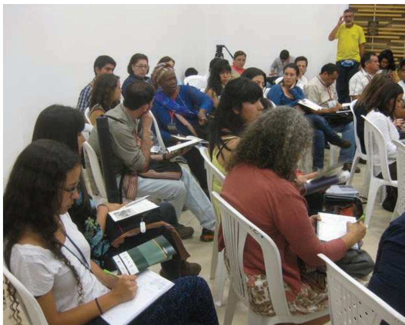
Aspecto del IV Congreso Latinoamericano de Etnobiología, Popayán, Cauca, Colombia.

Estos organismos, sumados al Grupo Etnobotánico Latinoamericano (GELA), al Seminario Argentino-Brasileño de Etnobiología y a decenas de instituciones educativas, gubernamentales y comunitarias, le otorgan a la etnobiología latinoamericana un campo de acción muy dinámico, inter y transdisciplinario, en el cual las comunidades originarias y locales tienen un papel muy activo en el desarrollo conjunto de la ciencia y los conocimientos tradicionales.