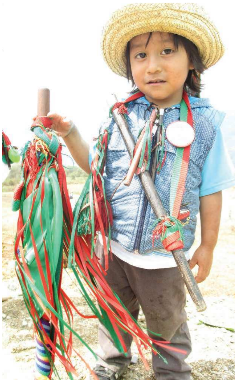
Bastón con cintas de colores, que significa mando, poder y guía de la comunidad Nasa de la Vereda de Loma Redonda, municipio de Jamaló, Departamento del Cauca, Colombia.