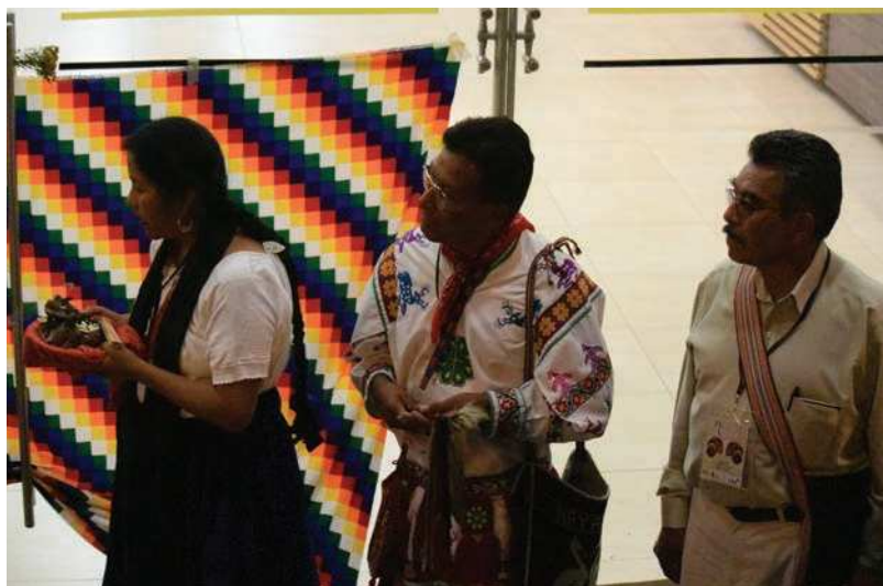
Aspecto del IV Congreso Latinoamericano de Etnobiología, Popayán, Cauca, Colombia.

Así mismo, exhortamos a quienes se encuentren realizando trabajos e investigaciones con comunidades y pueblos indígenas, afrodescendientes y campesinos, a que compartan con ellos/as este documento, y registren sus opiniones y propuestas, para que puedan compartir esta información con nosotros. Ello enriquecerá las aportaciones y dará cabida a más voces en las versiones futuras del Código.