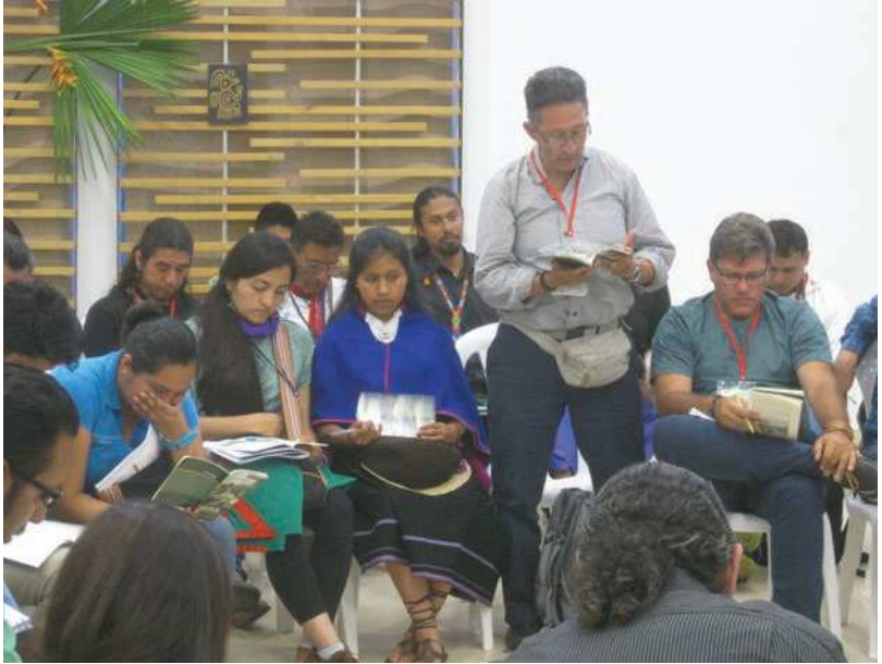
Aspecto del IV Congreso Latinoamericano de Etnobiología, Popayán, Cauca, Colombia.