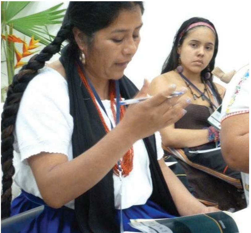
Aspecto del IV Congreso Latinoamericano de Etnobiología, Popayán, Cauca, Colombia.

A partir de las experiencias que se puedan generar en la práctica, la Comisión del Código de Ética de la SOLAE considerará realizar modificaciones y adecuaciones a este documento, las cuales deberán ser presentadas ante la Asamblea de la sociedad, para su discusión y aprobación, o no, en futuras versiones; haciendo de éste un documento permanentemente actualizado a las realidades y particularidades de la Etnobiología en América Latina.