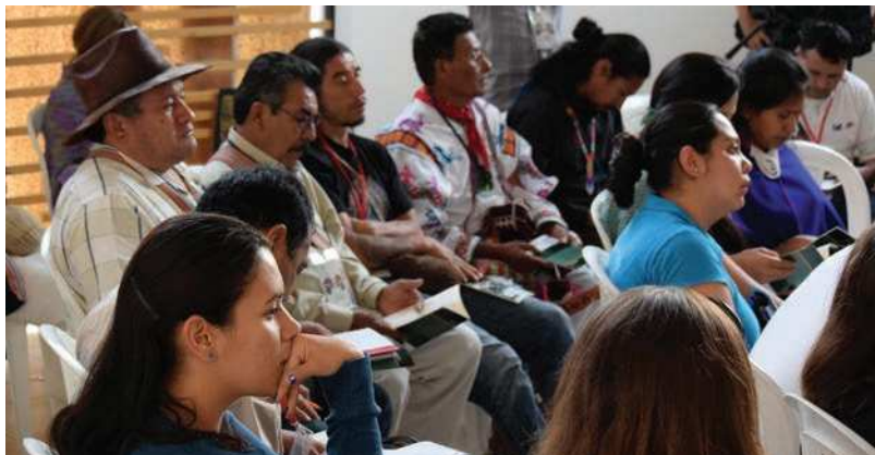
Aspecto del IV Congreso Latinoamericano de Etnobiología, Popayán, Cauca, Colombia.