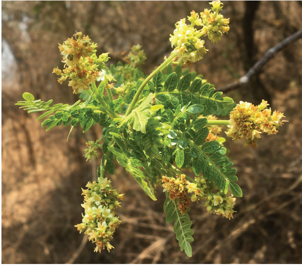
Figura 5. Flores masculinas del copal chino ( B. bipinnata ).