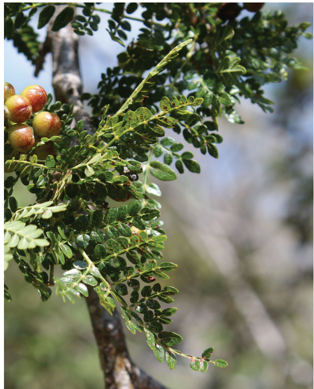
Figura 4. Aspecto general de las hojas del copal chino ( B. bipinnata ).