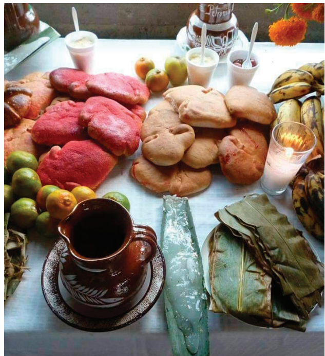
Figura 7. El copal en penca es un elemento central de las ofrendas del Día de Muertos.

tipo especial de silvicultura (manejo y cuidado de los árboles), el cual tiene por objetivo aumentar la densidad de individuos y elevar la calidad de la resina. Se prefieren aquellos árboles que producen grandes cantidades de resina y que ésta sea fuertemente aromática. Se practica la propagación por medio de estacas, aunque recientemente se hacen esfuerzos por reproducirlos por semilla. El manejo de los copales incluye diversas