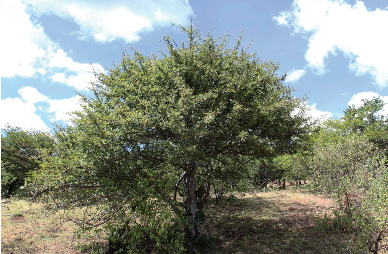
Figura 2. Aspecto general del árbol de copal chino ( B. bipinnata ) en su entorno natural, Morelos, México.