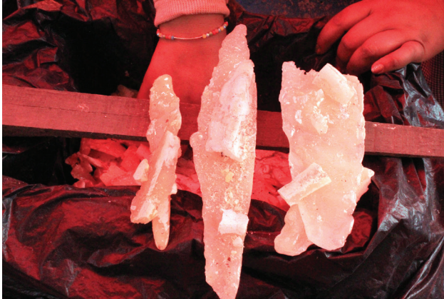
Figura 8. Resina de copal chino ( B. bipinnata ) comercializada en la Feria de Tepalcingo, Morelos, México.

labores de mantenimiento en las áreas silvestres, pero también son propagados como elementos forestales en diversos agroecosistemas como milpas, potreros y en huertos. La comercialización de la resina se lleva a cabo en tianguis y ferias, como la de Tepalcingo, Morelos (Figura 8). Desafortunadamente, en la actualidad se ha registrado con mayor frecuencia la comercialización de copal proveniente de otros países, el cual se extrae de otras especies, y se comercializa a precios muy bajos, ya que no tiene la calidad (olor y color) que el nacional. Animamos a los consumidores de copal a que privilegien el uso de los copales nativos, debido a que ayudan a conservar los bosques y estimulan a los productores y copaleros a seguir realizando esta actividad (Mena-Jiménez, 2018; Abad-Fitz et al. , 2020).