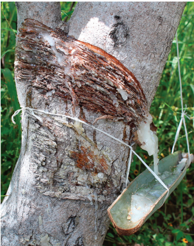
Figura 3. Forma en la que se extrae la resina de copal en el sur de Morelos, México.