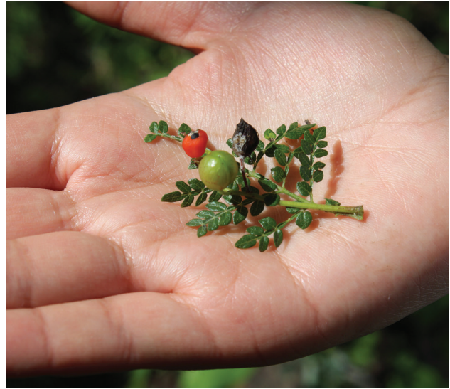
Figura 6. Frutos de copal chino ( B. bipinnata ), mostrando distintas fases de maduración.

para quemarse en sahumerios en diversos rituales, ceremonias propiciatorias o religiosas. Es un elemento característico en los altares el 2 de noviembre, en el “Día de Muertos”, la cual es una de las celebraciones más importantes de las diversas culturas de México (Figura 7).