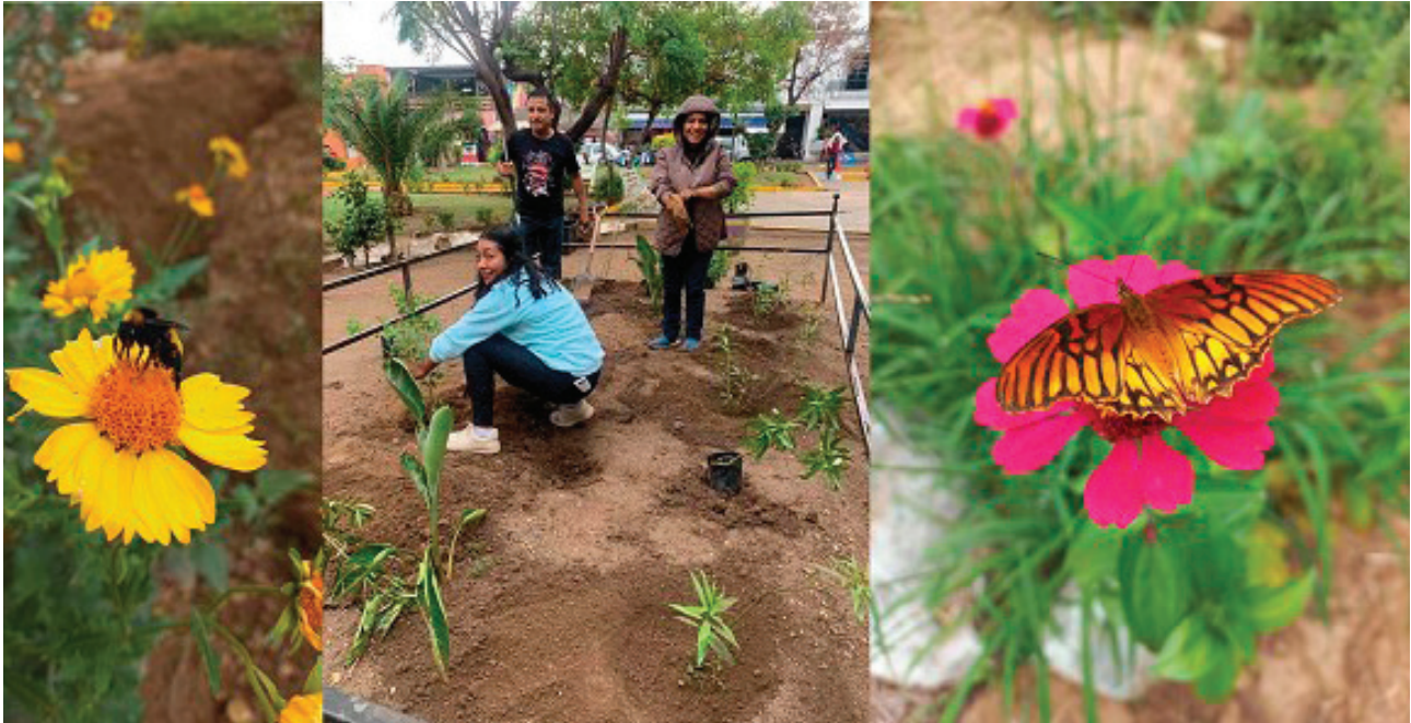
Figura 4. Jardines de polinizadores en el CIIDIR Oaxaca