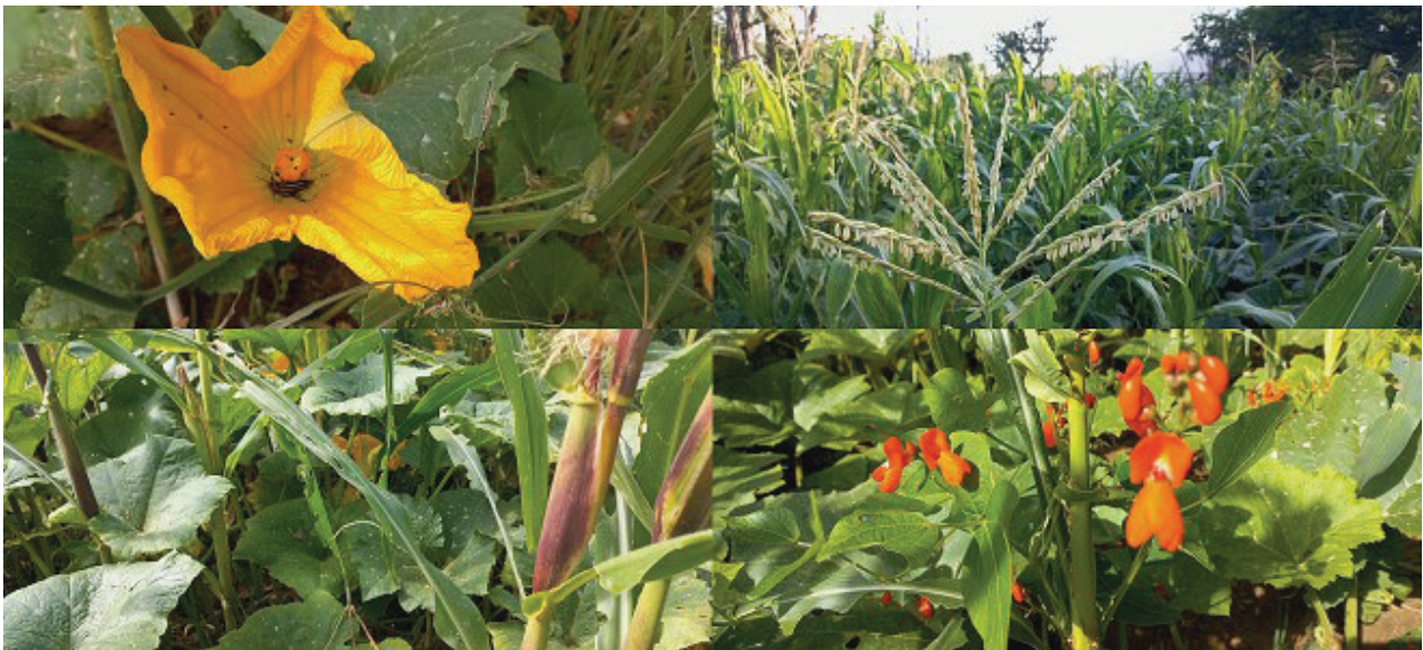
Figura 3. La milpa urbana en el CIIDIR Oaxaca

Los polinizadores juegan un papel muy importante en la producción de nuestros alimentos, la prestación de servicios ecosistémicos y el bienestar en general de todos los seres vivos, por lo que es sustancial, crear espacios que ofrezcan alimento y refugio a estos organismos. Se han creado cuatro jardines para polinizadores en escuelas primarias del Municipio de Santa Cruz Xoxocotlán, uno en el parque central del mismo municipio, uno en la UABJO, uno en el Jardín Botánico del CIIDIR IPN Oaxaca y otro más en el ITVO. Para el registro de la biodiversidad existente en el huerto y Jardín para polinizadores, se ha hecho uso de la plataforma Naturalista (iNaturalistMX, 2024), en donde estudiantes y trabajadores registran sus fotografías y en los últimos meses, se han registrado mayor número de insectos que antes de establecerse estos espacios. Además, se realizó el Primer Encuentro de Escuelas (primarias) con jardines para polinizadores, en donde los alumnos presentaron los resultados de la creación y seguimiento de sus jardines. Véase la Figura 4.