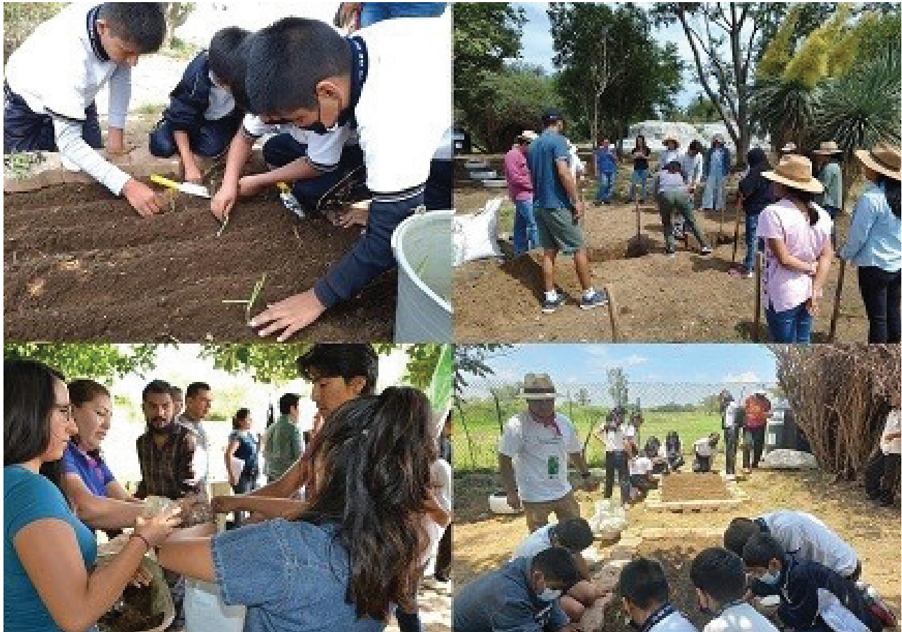
Figura 2. Huertos agroecológicos en el CIIDIR Oaxaca

La metodología transdisciplinaria involucró a actores locales e instituciones académicas, estableciendo un espacio educativo que fomenta la soberanía alimentaria en un contexto urbano (Méndez et al. , 2013). En marzo de 2023, estudiantes de posgrado, profesores y personal educativo prepararon 10 surcos de 18 metros para la siembra de maíz ( Zea mays ), calabaza ( Cucurbita pepo ) y frijol ( Phaseolus coccineus ), con un distanciamiento de 20 centímetros entre plantas. Durante la temporada de