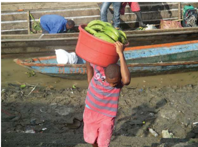
Vista de las comunidades negras de Quibdó, Departamento de Chocó, Colombia. El medio de transporte es la canoa y uno de los principales productos es el plátano, cultivado en el Municipio de Río Sucio, Municipio Pojaya.

2. Los miembros de la Sociedad Latinoamericana de Etnobiología que realizan investigaciones y trabajo etnocié debate, reconocen la situación histórica de injusticia y opresión económica, política, cultural, social y educativa en la que han subsistido los pueblos y comunidades locales, indígenas, campesinos y afrodescendientes que habitan en América Latina y el Caribe. Por ello, los miembros de la SOLAE tienen el compromiso de respetar, salvaguardar, reconocer y revalorar la integridad identitaria de pueblos y comunidades locales. Además de difundir su riqueza cultural, promover el respeto por su cultura, el derecho a la salvaguarda de los territorios, el patrimonio biocultural colectivo perteneciente a los pueblos, comunidades locales, indígenas, campesinos, y afrodescendientes de América Latina y el Caribe.