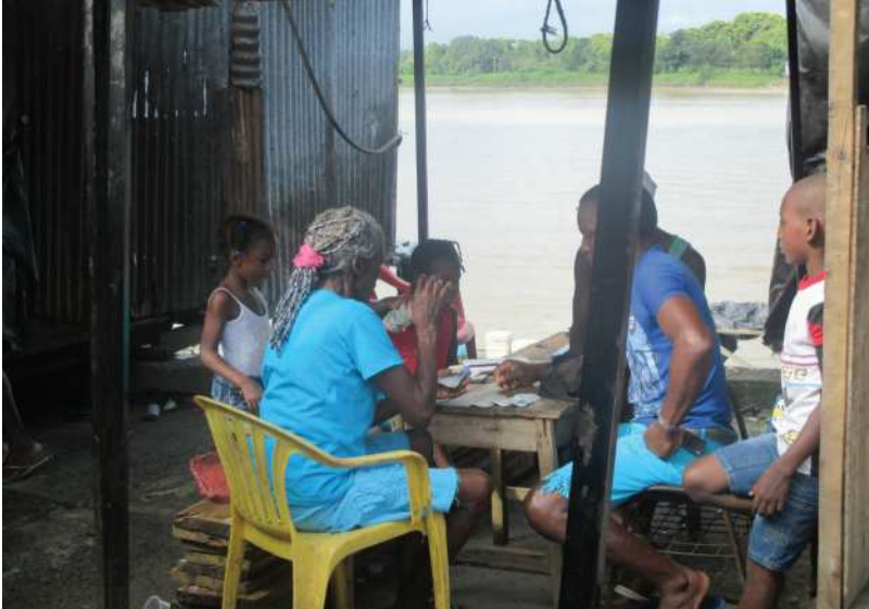
Mercado de la plaza principal en Quibdó, Departamento del Chocó, Colombia. La ciudad se encuentra en una de las principales regiones forestales del país y con varias poblaciones indígenas.