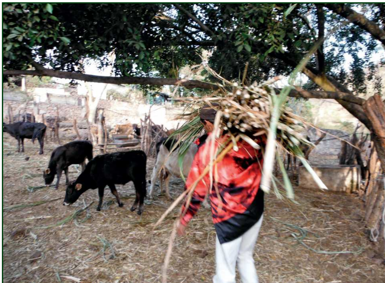
Figura 2. El ganado se adapta perfectamente a las condiciones productivas y económicas de los campesinos minifundistas de la REBIOSH.

Aspectos que apoyan esta discusión en las apreciaciones