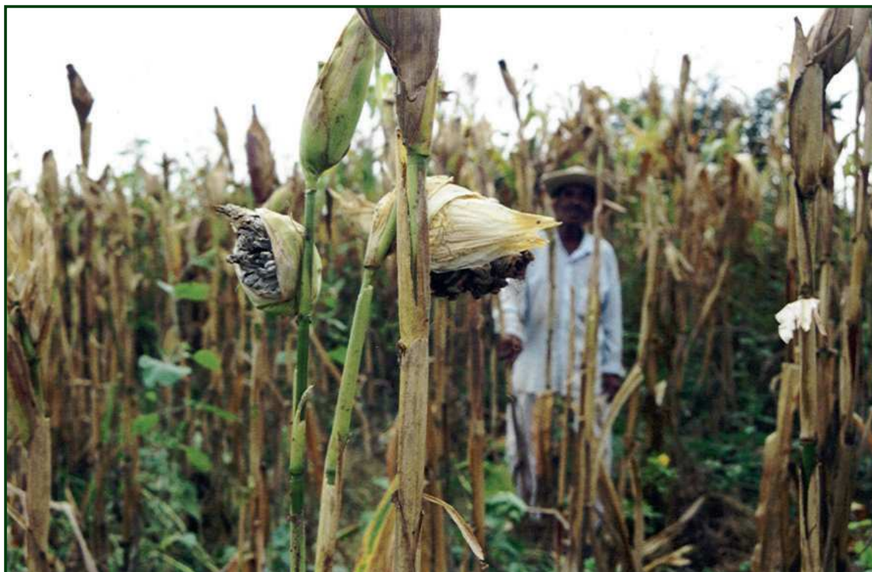
Figura 2. La producción de maíz tiene compatibilidad técnica con la producción de ganado, que se adapta a las condiciones de la economía campesina.