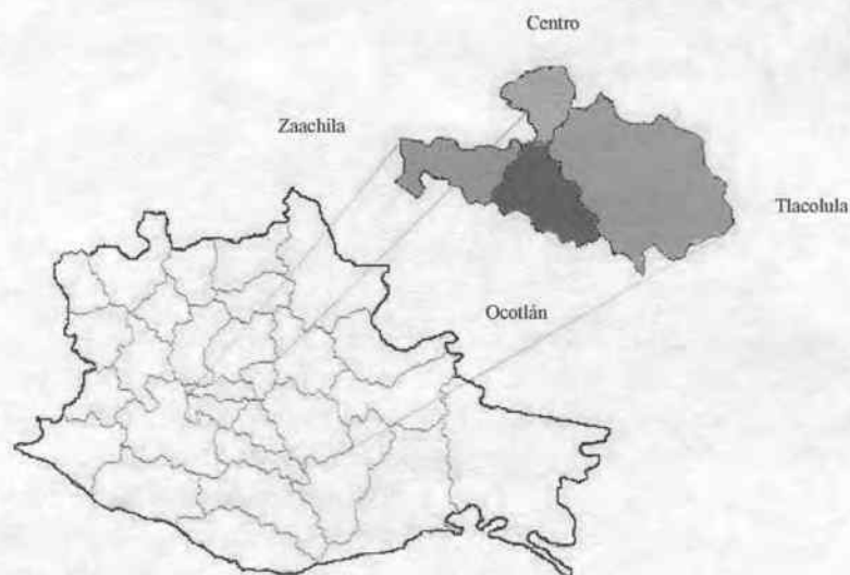
Figura 1. Región de los Valles Centrales del Estado de Oaxaca, México.

En los distritos de los Valles Centrales de Oaxaca el día de plaza se realiza una vez por semana. Para este estudio se consideraron los mercados de los municipios de Ocotlán, Tlacolula, Central de Abastos y Zaachila (Figura 1) por ser en donde existe la mayor afluencia de productores, intermediarios y consumidores de diversos productos, entre ellos, los huevos de las gallinas criollas.